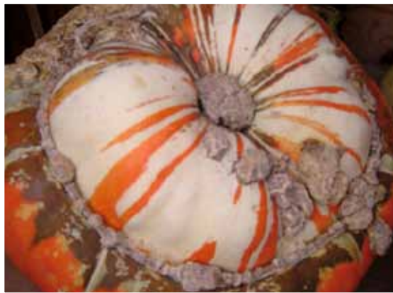
Pompoen, symbool bij Halloween

het griezelfeest waarbij men verkleed over straat gaat met lampionnen en waarbij uitgeholde pompoenen met een lichtje branden voor de huizen. Volgens een legende is een spin die men ziet op 31 oktober een overledene waar men heel veel om geeft.