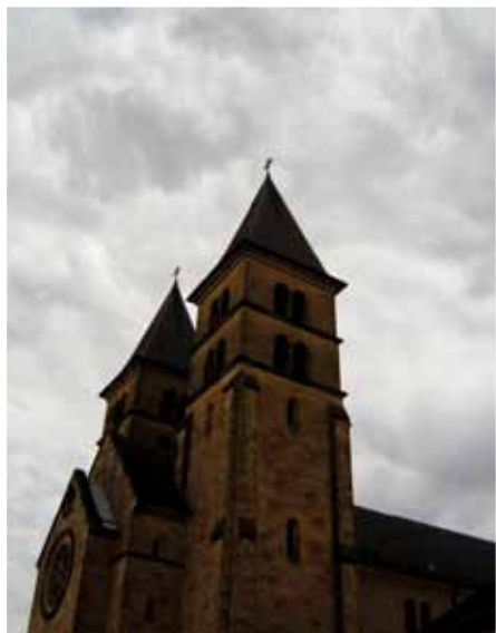
Basiliek Echternach, Luxemburg

de stad met reliekschrijn van de heilige Willibrord. Na de dood van Pepijn II van Herstal, een opzichter over de hofhouding, werden andere grondgebieden in Brabant en Limburg overgedragen aan deze heilige. Kerken en kloosters werden gesticht en ook weer verwoest. De naam Sint Willibrordus is nog zichtbaar op kerken, basisscholen en andere instellingen. De Willibrordusputten en -bronnen, waarvan de meeste zich in Noord-Brabant bevinden, hebben een grote genezende werking omdat hierin Christus als enige en eeuwige bron heerst. De genezende werking is voor vallende ziekten, zenuw- en spierziekten.