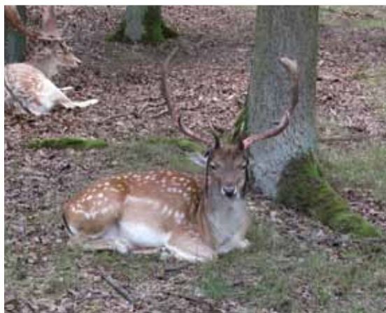
Hert, symbool van St. Hubertus

Dierenliefhebbers, waaronder veel paardenhouders, hechten een bijzondere waarde aan het geven van gezegend zielenbrood aan hun dieren. Het Hubke kent vaak een dubbele zegening: Het kruis dat is aangebracht op elk broodje en de zegening met wijwater door een geestelijke.