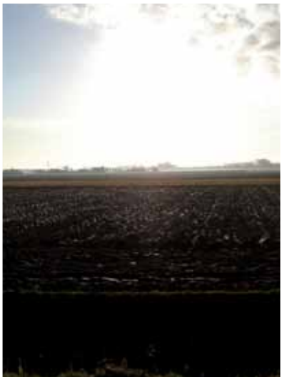
Lege akker na oogsttijd

In protestantse kerken wordt soms een creatief oogststuk gemaakt dat bestaat uit groenten als boerenkool, uien, spruiten, pompoenen en diverse bloemen zoals chrysanten en gedroogde hortensia's. Traditioneel worden er onder het motto 'bid én werk' materialen als kleding, dekens, voedsel en speelgoed ingezameld voor Oost-Europa.