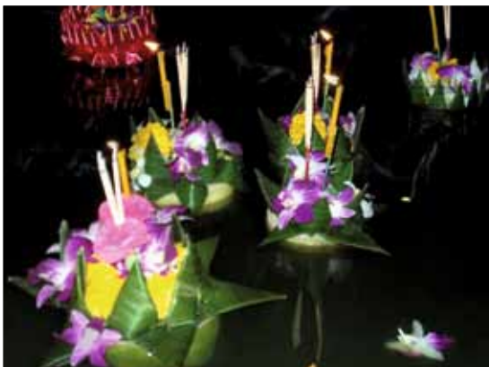
Loi Krathong

Loi Krathong valt op 10 november 2011, 28 november 2012, 17 november 2013 en 6 november 2014