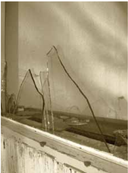
Scherven, typerend voor Kristallnacht

Kristallnacht is een naam voor de vele ruiten en winkelruiten die gesneuveld zijn. Andere namen voor Kristallnacht zijn Novembepogrom 1938 en Reichspogromnacht.