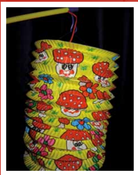
Lampion, traditie bij optocht

De viering van Sint Maarten in Nederland kenmerkt zich door lampioptochten door straten met kinderen die liedjes zingen en snoepgoed vragen aan mensen waar aangebeld wordt. Op 10 november worden in West-Vlaanderen Sint Maartenstoeten gehouden die een gelijkenis hebben met de optochten van Sint Nicolaas. Sint Maarten is schutspatroon, een beschermheilige, van de stad Utrecht. Een stad die een eigen Sint Maartensberaad heeft. Op de plaats van het Domplein werd in de zevende eeuw een kerkje gebouwd dat werd gewijd aan deze heilige.