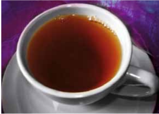
Kopje thee voor ontspanning

of wekelijks terugkeren. De Landelijke Vereniging voor Mantelzorgers en Vrijwilligerszorg Mezzo, organiseert elk jaar tal van activiteiten in elke provincie om mantelzorgers in het zonnetje te zetten en een verwendag te laten beleven.